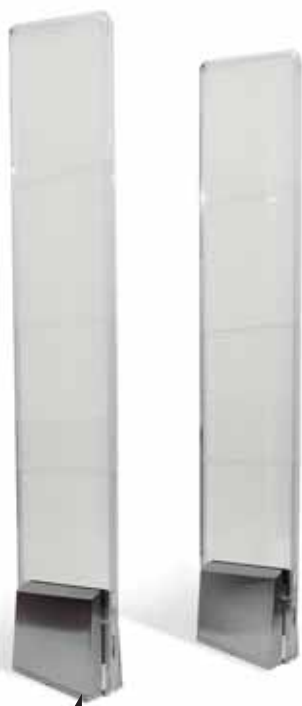
PC технология JSB Tri-Light 3009 2-х антенная систе