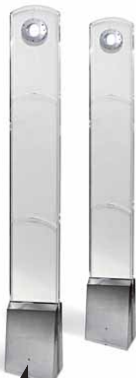
PC технология JSB Tri-Light 1004 2-х антенная система